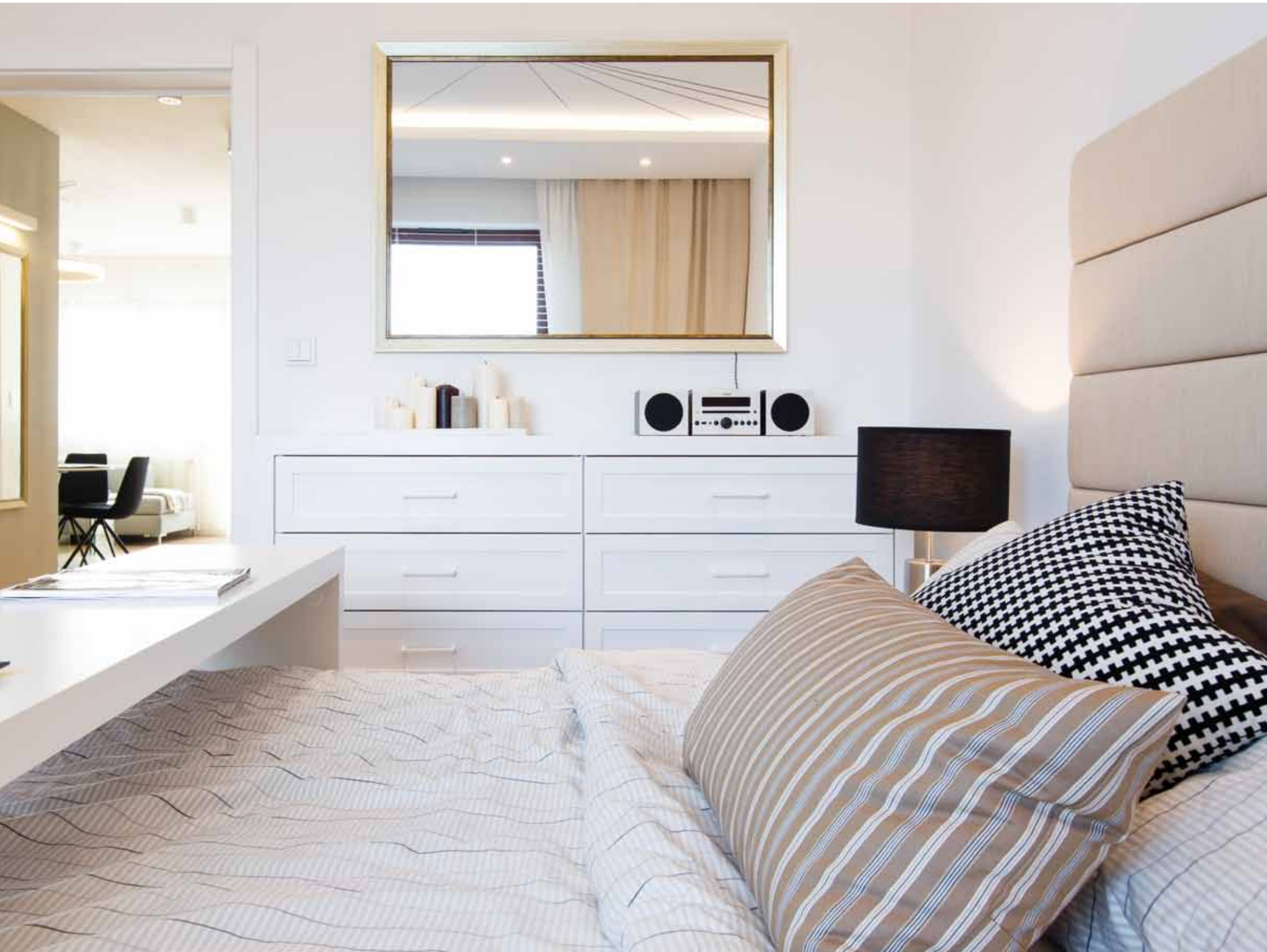
Dość nietypowym rozwiązaniem jest zastosowanie na suficie sypialni fototapety, przedstawiającej skrót perspektywiczny konstrukcji mostu, dzięki czemu uzyskany został efekt głębi i tym sposobem w jeszcze jeden sposób udało się optycznie powiększyć przestrzeń.